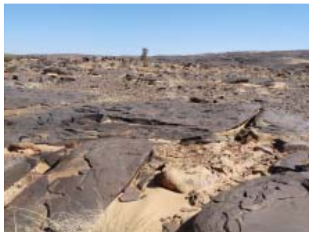
Pour la direction d'école, les débats sur la Refondation se résument à un quasi désert...

les activités périscolaires), les difficultés sont également palpables.