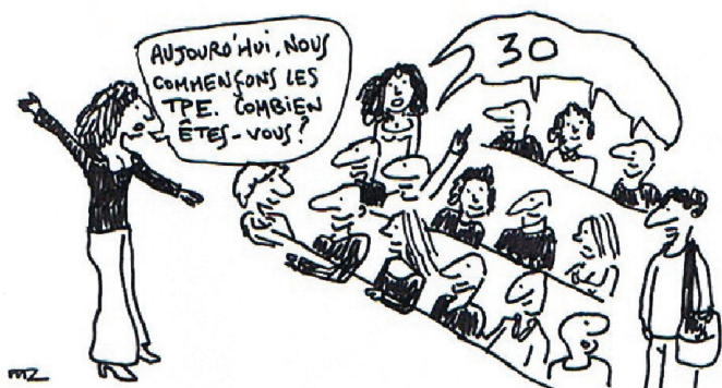
Croquis : Marc Le Roy

► Si vous êtes élu-e-s paritaire-s, contactez votre rectorat pour connaître le calendrier des différentes opérations.